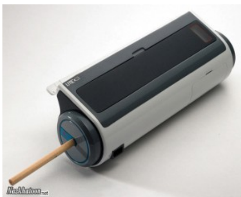
شکل (۱) نمونه ای از دستگاه کاغذ قلم کن