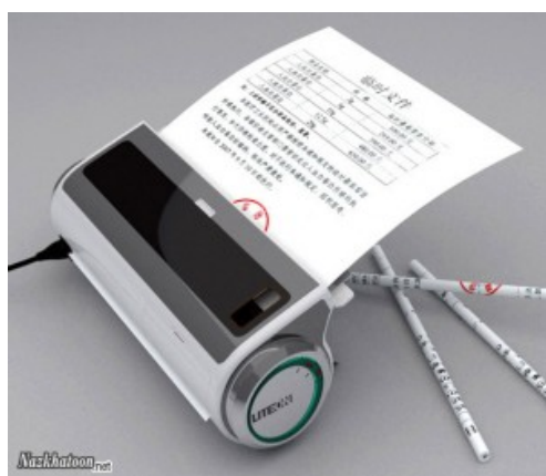
شکل (۲) نمونه ای از دستگاه کاغذ قلم کن